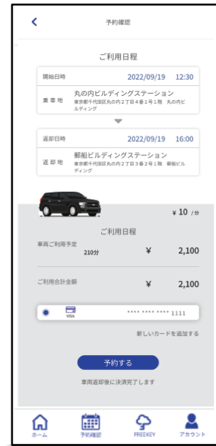
クレジットカード決済