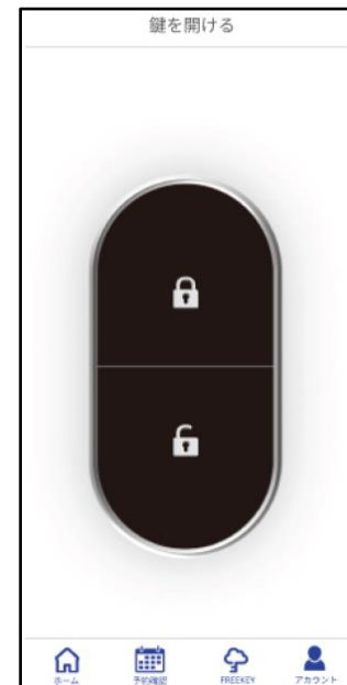
スマートフォンで車の 施解錠が可能