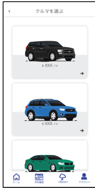
車両選択 ※車両画像はイメージです