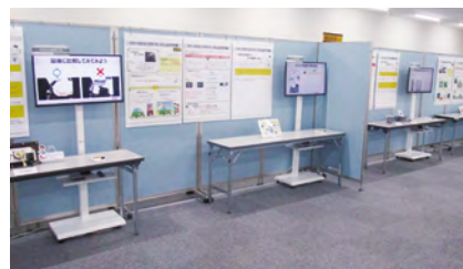
過去の品質不具合を展示

過去にお客さまにご迷惑をかけてしまった「品質不具合」とそこから得た「学び」を後世へ伝承し、社員一人ひとりが品質に対する意識を高め、常に製品安全を最優先する風土を維持し続けるために誰でも学習できる品質伝承ルームを常設しています。