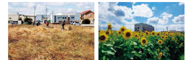
耕作放棄地だった以前の風景