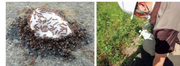
アルゼンチンアリ

生息エリアを拡大していくアルゼンチンアリの封じ込めのため、知恵や技術を出し合いながら活動を進めています。