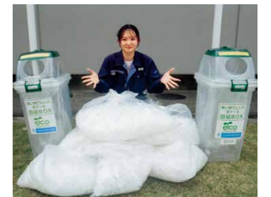
回収したコンタクトレンズ空ケース

HOYA株式会社アイケアカンパニーが行う使い捨てコンタクトレンズ空ケース回収の取り組み、「アイシティecoプロジェクト」に参加しています。使い捨てプラスチックを確実に回収管理することで、廃プラによる海洋汚染防止につながります。各工場での活動への参加を呼びかけ、これまで69kg(空ケース約69,000個分)を回収しました。