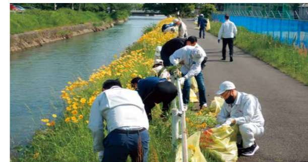
オオキンケイギク駆除

また、大口西小学校にあるビオトープをホテルやトンボの住処にしていくため、維持管理の取り組みを小学校や地域住民と連携して行っています。