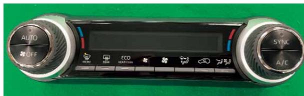
ヒーターコントロールスイッチ

タッチパッドの振動応答用モーターに使用されている軸受け油、ヒーターコントロールスイッチの液晶ディスプレイをREACH対応品へ変更しました。