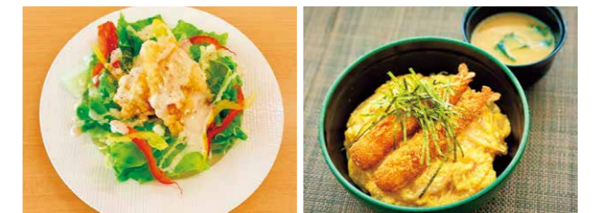
白身魚のフリッター

食堂では、持続可能で環境に配慮した漁業で捕られた魚介類「サステナブルシーフード」を使用したメニューを提供しています。食事という毎日欠かすことのできない身近なところから「海の豊かさを守る」選択をしてもらうことで、SDGsの目標への貢献を生活の中で意識してもらい、エシカル消費などの自主的な行動へ促すよう取り組んでいます。