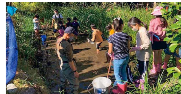
ビオトープ保全活動