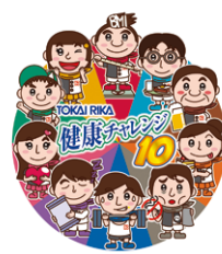
健康チャレンジ 集合マーク