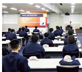
安全動画をを用いた未然防止教育

東海理化で発生した労働災害は、グループ内で再発させないため、発生状況から災害原因を分析、対策までを動画で分かりやすく解説し他工場の未然防止に活用しています。