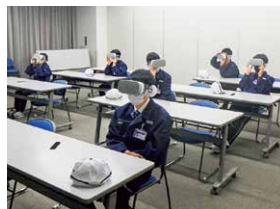
VRを用いた安全教育

高所からの墜落や設備への巻き込まれなど、重大災害を体感できる安全教育を実施しています。