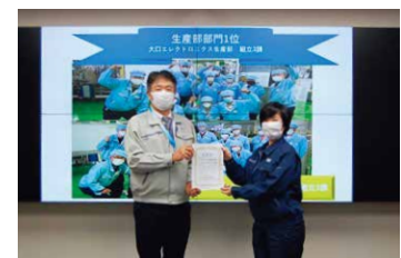
ワーキングイベント 表彰式の様子