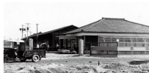
創業当時の西枇杷島工場