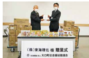
当社が保有している防災用保存食の一部を大口町、豊田市、豊川市の社会福祉協議会フードバンク事業に寄贈しました。