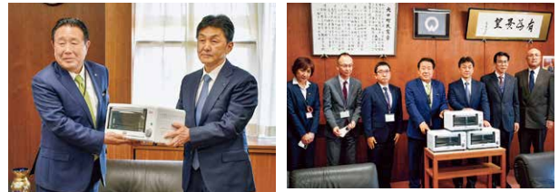
地域のコロナウイルス感染症拡大防止対策に役立てていただこうと大口町・豊川市・清須市へ紫外線除菌庫を寄贈しました。