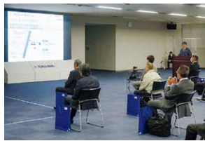
2021年度調達方針説明会

毎年4月に主要仕入先さまへ「調達方針説明会」を開催し、事業環境やグループ方針、調達基本方針の説明を通じて、安全・防災、品質確保、安定供給、競争力確保、コンプライアンスなど各種活動と目標を共有し、連携をしています。また、品質・コスト・安定供給などにおいて、優秀な成績を取めた仕入先さまを称え表彰しています。