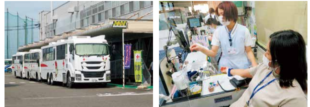
当社は毎年社内献血を実施しており、2021年度はコロナ禍の血液不足を受けて、各工場で回数を増やし夏冬の2回実施しました。(献血751名が採血)