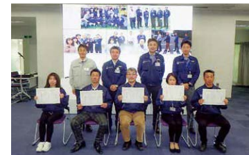
ウォーキングイベント表彰式