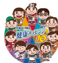
健康チャレンジ 集合マーク