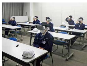
VRを用いた安全教育

高所からの墜落や設備への巻き込まれなど、重大災害を体感できる安全教育を実施しています。