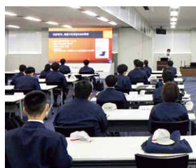
安全動画を用いた未然防止教育

東海理化で発生した労働災害は、グループ内で再発させないため、発生状況から災害原因を分析、対策までを動画で分かりやすく解説し他工場の未然防止に活用しています。