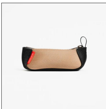
「シートベルトミニポーチ」 1,430 円 (税込)

サイズ：横幅 12cm × 高さ 4.5cm × マチ 5cm 重さ：30g 素材：シートベルト端材