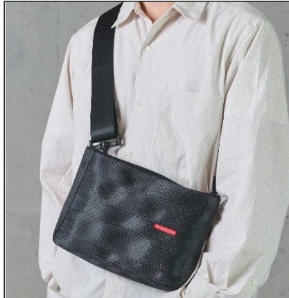
「シートベルトサコッシュ」

サイズ：横幅 21.5cm (下部) /35cm (上部) × 高さ 21cm × マチ 15cm 重さ：120g 素材：シートベルト端材×合皮 端材