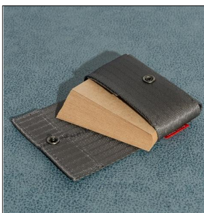
「名刺入れ」 2,200 円 (税込)

サイズ：横幅 12cm × 高さ 4.5cm × マチ 5cm 重さ：30g 素材：シートベルト端材