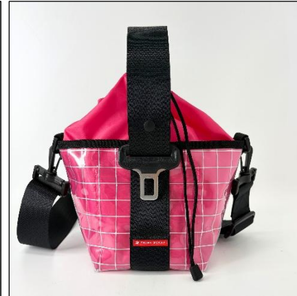
「ワンハンドルクリアトート」

サイズ：横幅 28cm × 高さ 20cm × マチ 4.7cm 重さ：325g 素材：シートベルト端材