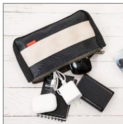
「シートベルトポーチ」 2,750 円 (税込)

サイズ：横幅 10.5cm × 高さ 6.5cm × マチ 2cm 重さ：40g 素材：シートベルト端材