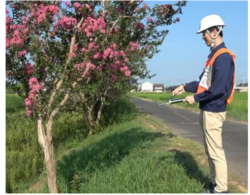
グリースガンで数 m 先へ飛ばして塗布する様子