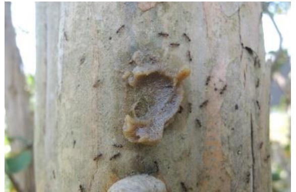
樹木の幹に塗布したぷりっとベイトに群がるアリ