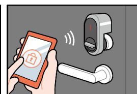
スマートフォン操作で解錠/施錠