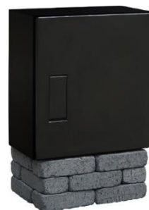
「RusuPo with FREEKEY(仮称)」