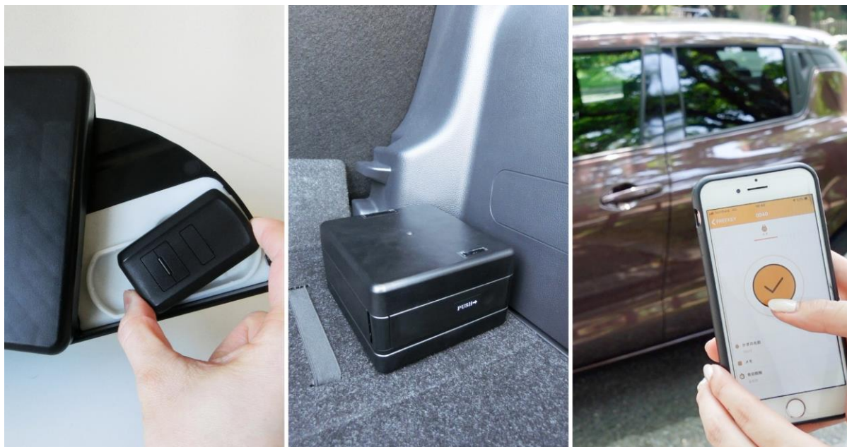
参考写真：左「FREEKEY BOX」、中央はトランクスペースへの設置例、右「FREEKEY for CAR」アプリ操作イメージ