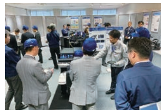
機関投資家・アナリストの皆様向け施設見学会

また、2018年12月には、機関投資家、アナリストの皆様を当社へお招きしての施設見学会を実施し、半導体の取り組み、開発の方向性について、ご確認いただきました。