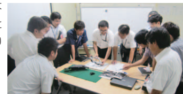
▲日々の調査進捗を関係者で確認/討議している様子

市場での不具合情報、不具合品を早期に入手／解析することで、1日でも早く対策品を市場に供給し、お客さまのご迷惑を最小限に抑えられるよう、TR-EDER ※ 活動と銘打ち、全社一丸となり取り組んでいます。