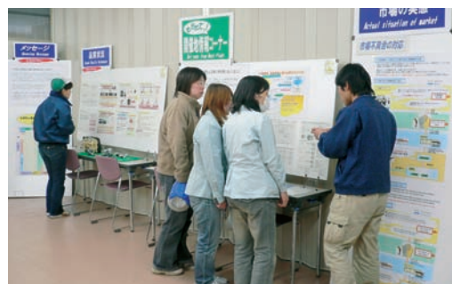
▲未然防止事例展示会

国内外子会社を含めた未然防止事例展示会を毎年開催しグループ会社全員の品質意識高揚に努めています。