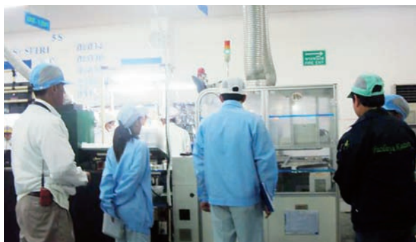
▲海外事業体での活動の様子

仕入れ先様各職場での重大災害につながる「危険源」に該当する作業の洗い出しにより、その作業の安全性確認を仕入先様と共に点検・検証を進め、相互研鑽を図りながら重大災害の未然防止に努める活動をしています。また、海外の事業体でも日本と同様に各仕入先様と協力した活動を実施しています。