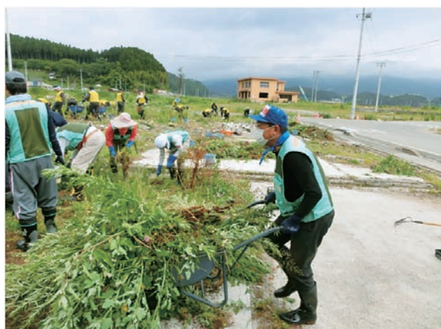
▲宅地跡の整備(陸前高田市)

トヨタグループ各社協働による被災地復興支援ボランティア活動に、これまでに延べ12名の社員が参加しました。参加者は5日間の日程で現地へ入り、陸前高田市、大船渡市、住田町内で宅地跡の整備(草刈り・細かな瓦礫の収集・分別や花壇作り)、子どもの遊び場作りなどを行いました。参加者からは「激励に行った自分が、反対に力をもらって帰ってきた」「機会があれば、また参加したい」との声が寄せられました。