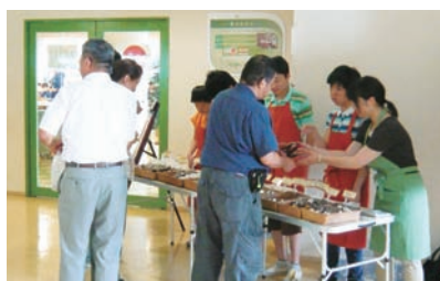
▲障がい者施設の構内販売（豊田工場）

各工場構内で、昼休みを利用して近隣の障がい者施設の方々が手づくり品などの製品を販売する場を提供しています。また各施設が開催するイベントなどには、社員がボランティアとして運営協力しています。