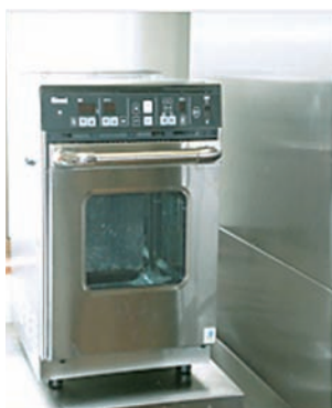
▶ 寄贈したオープンレンジ

地域貢献活動の一環として、愛知県内の当社事業所近隣にある福祉施設へ毎年寄贈を行っています。