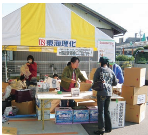
▲海外救援衣料の回収