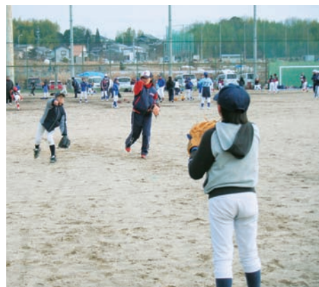
▲当社女子ソフトボール部によるスポーツ教室