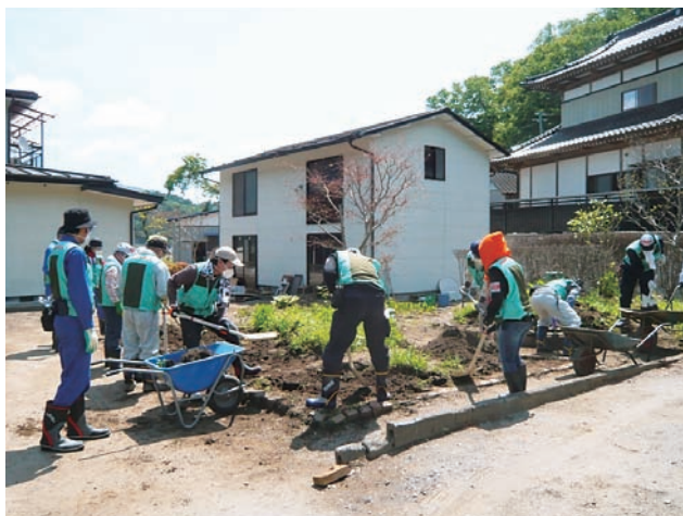
▲花壇作り(陸前高田市)