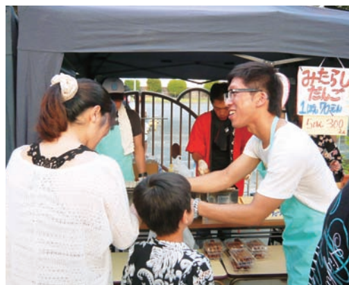
▲障がい者施設でのイベント協力