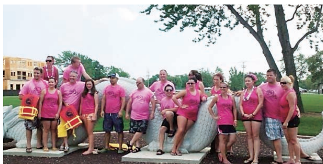
▲TRQSS社員のドラゴンボートレース参加者