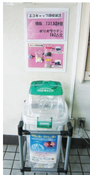
▲エコキャップ回収箱置場

全社で「エコキャップ回収運動」を実施しています。NPO法人「エコキャップ推進協会」の活動に同調する形で、回収した飲料のポリプロピレン製キャップの再資源化と同時に、その売却益を使って各種ワクチンの購入費用として発展途上国の子どもたちに寄付しています。2012年度末までに約68万個、ポリオワクチン841名分を提供できる額を寄付しました。