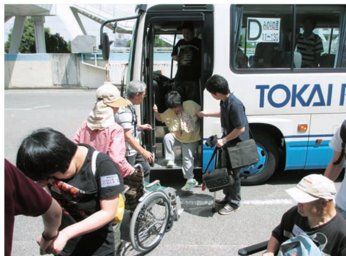
▲ 障がい者との一日ふれあいツアー