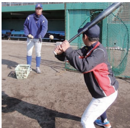
▲当社硬式野球部によるスポーツ教室

社内外の様々なボランティア活動やセミナーに、多くの社員が参加しています。2012年度には延べ361名の社員・家族が参加しました。参加者から「私の小さなお手伝いが人に喜ばれ、自分にも喜びが湧いてきました」などと感想がありました。