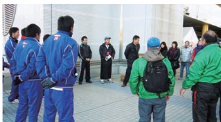
▲社員ボランティアの打合せ