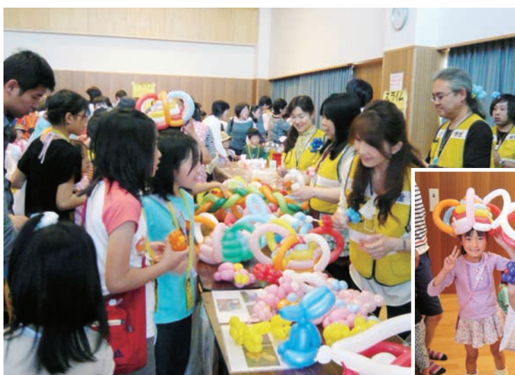
▲地域児童センターイベントボランティア