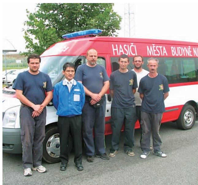
▲ 寄贈した社有車とTRCZ社員の消防団員

TRCZ(チェコ共和国)では、地元ボランティア消防団に、社有車として使用していたクルマを寄付しました。チェコでは国が運営する消防署の他に、市町村が運営するボランティアによる消防団があり、TRCZの社員の中にも仕事の傍らボランティア団員として活動している方がいます。