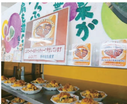
▲社員食堂でのチャリティー・ヘルシーメニューの提供

各工場社員食堂でチャリティー・ヘルシーメニューを提供しています。肥満や生活習慣病のリスクを下げるメニューを喫食すると価格に寄付金10円が含まれており、集まった寄付金は公益財団法人アジア保健研修所が行うフィリピンの子供たちの食生活改善事業に活かされます。寄付金額は2012年度末までに累計235万円を超えました。さらに改善を加え、継続していく予定です。