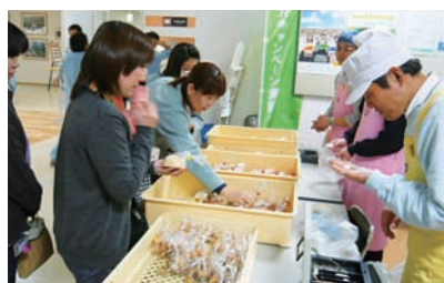
▲障がい者施設の構内販売（音羽工場）