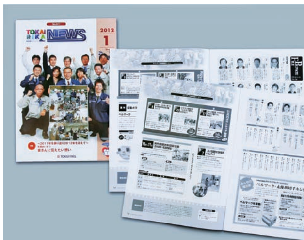
▲ 社内報へのボランティア情報掲載

社員およびOB、その家族などを対象にボランティア情報の提供、セミナーやイベントの企画を行っています。また、毎年新入社員を対象に社会貢献研修プログラムの一つとして障がい者とのふれあいツアーを実施するなど、啓発・理解促進に取り組んでいます。