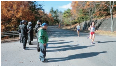
▲走路員として運営に協力

7年目を迎えた、愛知県の全市町村がチームを組んで参加する「愛知県市町村対抗駅伝競走大会（愛知駅伝）」に、当社は第1回大会より主要な協賛スポンサーとして協力しています。大会当日は社員がボランティアで走路員として運営にも協力しました。