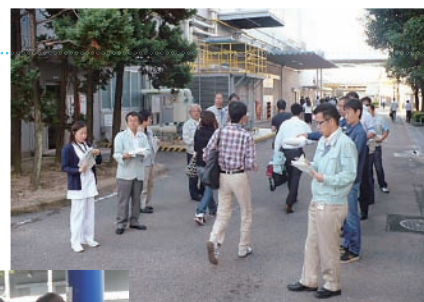
▲労働衛生を啓蒙するピラを配布