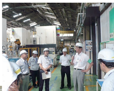
▲工場間相互交流会