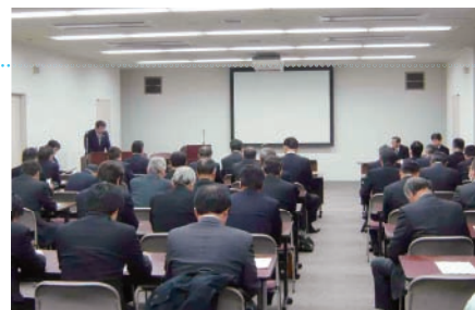
▲仕入先合同説明会の様子

各国環境法規・規則遵守の為に仕入先様のご協力は不可欠であり、スムーズな導入と対応にあたり、社内専門部署と連携をとりながら仕入先様への合同説明会等を通じ、法規動向・お客様の対応方針・日程、当社の対応方針と活動計画を紹介し、仕入先様と情報の共有化と連携をとりながら活動を進めています。