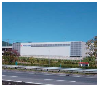
立体駐車場壁面の太陽光パネル

立体駐車場において太陽光発電、屋上緑化、ソーラー発電式外灯、LEDアプローチライト、ソーラーバッテリー表示灯、リサイクルカラー砂利・舗装材を採用した環境に配慮した駐車場となっています。