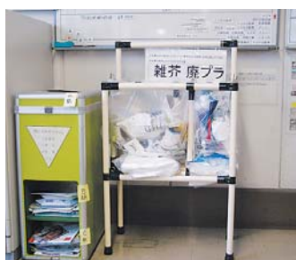
事務所内の廃棄物集積所

事務所内のフロア内に集積所を設けてゴミの分別と業務以外の私物ゴミの持ち帰りを推進しています。また、15時・定時における休憩時間帯の消灯を実施し省エネに対する意識高揚を図りました。