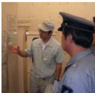
地下水浄化装置緊急停止時の対応訓練

年1回、緊急事態が発生した場合を想定して、被害を最小限にするための対応処置の訓練を実施しました。