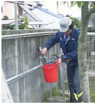
地下水の水質確認

土壌中の汚染物質を真空吸引装置による回収、浄化、地下水の汚染状況の定期(2回/月)確認の継続実施をしています。その結果、敷地外への汚染物質の流出はありませんでした。