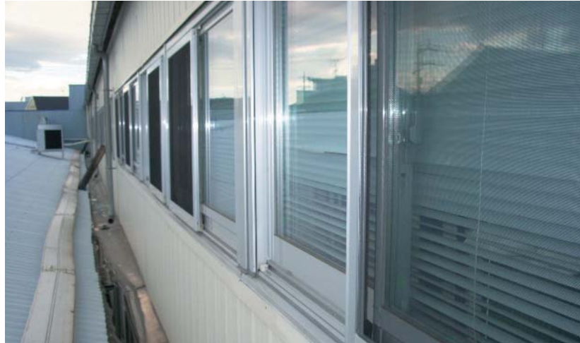
2重サッシにより熱を遮断

断熱塗装や2重サッシなどによる空調効率の向上、天井照明のインバーター化による消費電力の削減を図りました。