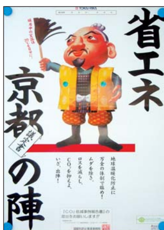
省エネポスター(冬版)