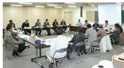
地域懇談会(音羽工場)

各工場にて、地域の方々(近隣市町村の区長、地域住民など)を対象に地域懇談会を開催しました。工場見学などを通じ、当社環境活動の理解を深めてもらうとともに地域住民との意見交換をはかりました。