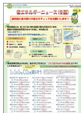
省エネルギーニュース(冬版)