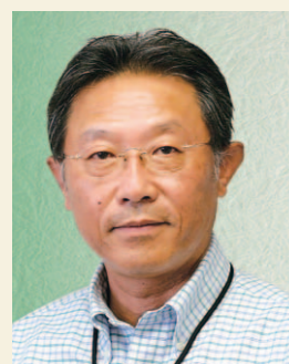
全社環境管理責任者 常務取締役

技術的な点からも、全社としての環境活動取り組みの進め方でも改善を進めていきます。