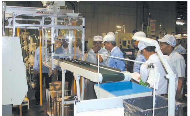
生産工程の安全点検

また、有害な化学物質を管理・削減するとともに、定期的な環境測定を行い、快適な職場環境づくりを推進しています。