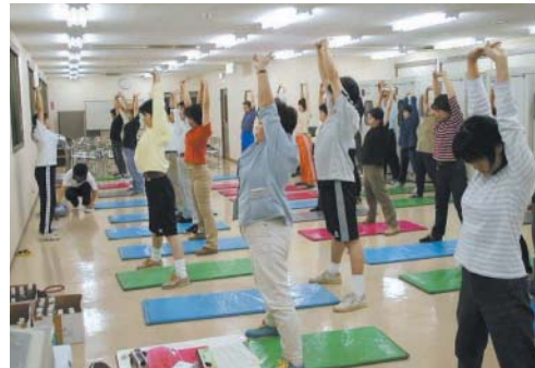
健康づくり実技講習

社会的な変化のスピードが速く、従業員のストレスも増大してきています。そのため、定期的な健康診断に対する確実なフォローに加え、メンタルヘルスへの対応が重要となっています。この取り組みは海外赴任者に対しても同じく行っています。