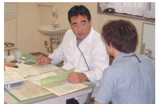
産業医による面談